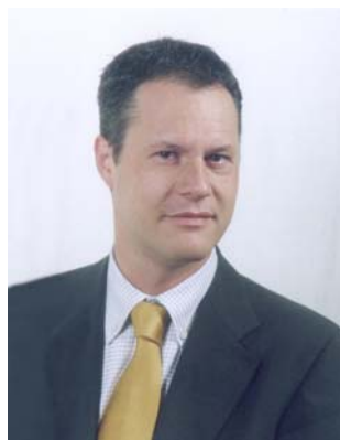
Massimo Giorgetti VdS e Assessore Provinciale alle Politi-